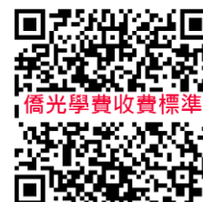
僑光學費收費標準